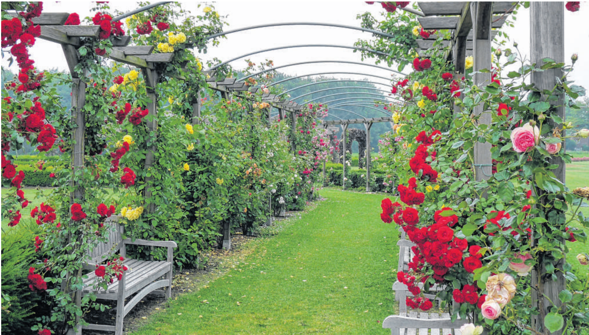
Der von Rosen gesäumte Weg zum Schaugarten des Rosariums Lottum.